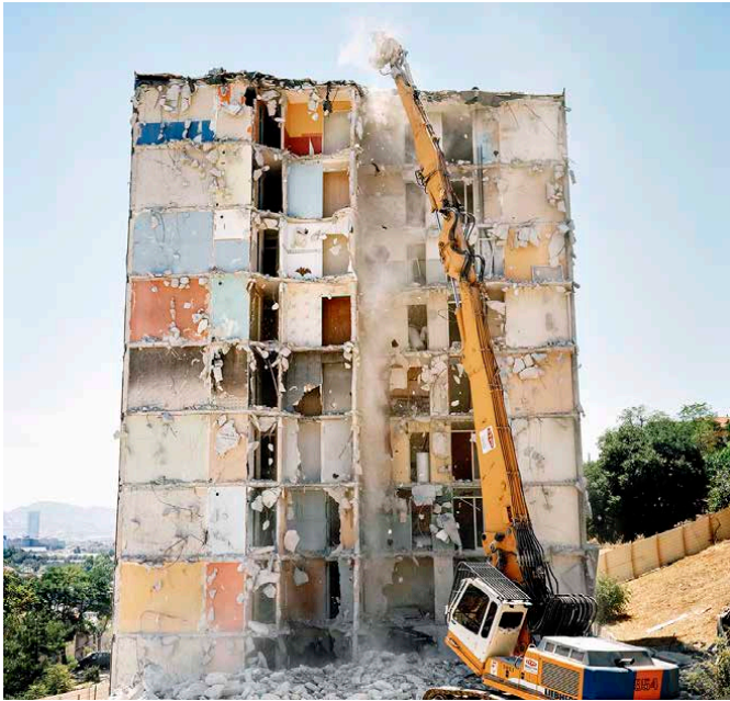
Les Créneaux, juillet 2009