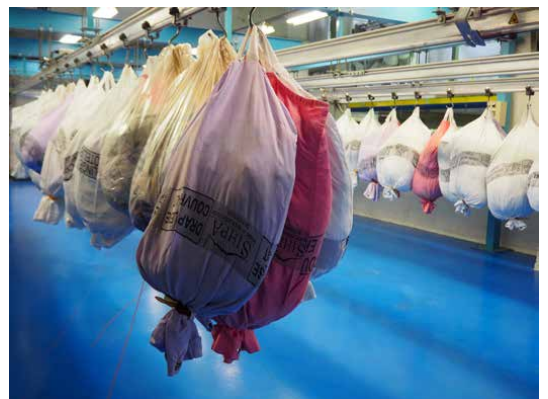
On lâche rien, 3bisf, 2016 © Jeanne Moynet &amp; Anne-Sophie Turion

On lâche rien 10 novembre au 15 décembre 3bisF, Aix-en-Provence 04 42 16 17 75 ♦ 3bisf.com