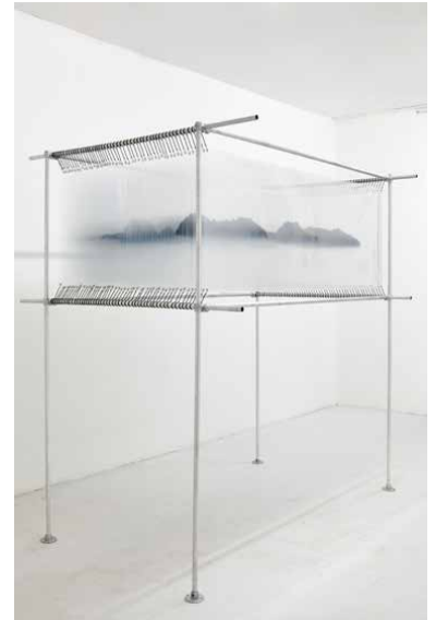
Julien Levy, Sans titre (Bureau à secret) 2016, Bois, verre, graphite sur papier, matériaux divers. Bureau réalisé avec l'aimable concours de Jérôme Dumetz