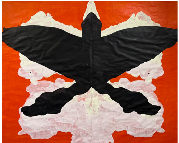
Katharina Schmidt, Falter , 2025, acrylique sur papier