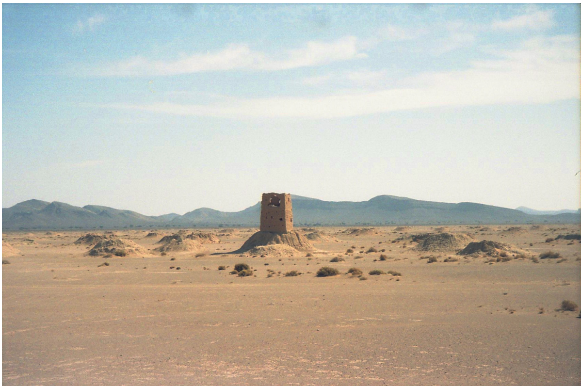
© Driss Aroussi, Borj el mechkouk , 2023, projection vidéo, 32"

Le film dans son entièreté pourra être source de réflexion plastique pour les élèves, en particulier ceux du cycle 4. Il leur permettra d'appréhender le numérique comme technique, instrument, et matériau dans une intention artistique.