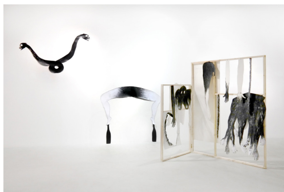
Katrin Ströbel, How to dance on ruins , 2025, ensemble de dessins découpés How to (ghost and phantoms) , 2025, installation, bois, graphite sur papier