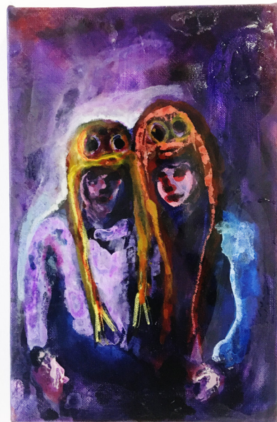
Yassine Balbzioui, Another Half Splash , 2026, acrylique et résine sur toile