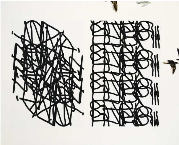
Katharina Schmidt, extraits de la série Graff , 2023, image numérique

L'œuvre Falter permet d'aborder une technique simple fondée sur la loi géométrique de la symétrie, ainsi que de réfléchir aux associations de couleurs et au médium de la peinture. La série Graff pourra faire l'objet d'une présentation de la technique numérique qu'a employée l'artiste, ainsi que de la technique du décalquage.