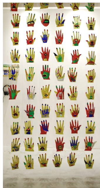
Mohammed Laouli, Nos mains toustes , 2026, adhésif et papier hologramme découpés