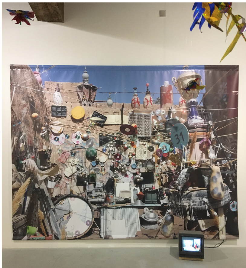
Mohammed Laouli, Fragments d'un astre , 2026, tirage sur bâche

Fragments d'un astre fait notamment écho au programme d'arts plastiques du cycle 3, qui propose de sensibiliser les élèves aux matériaux utilisés dans la confection d'œuvres d'art, ainsi qu'à l'emploi, à la transformation et à l'évolution de ces matériaux.