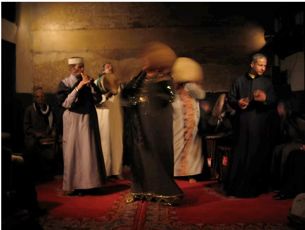
Yasmina Ben Ari, ZĀR, 2026, extrait du triptyque photographique

La dimension picturale du triptyque photographique de Yasmina Ben Ari, qui rappelle certains clairs-obscurs picturaux, pourra faire l'objet d'une présentation du procédé utilisé par l'artiste. La dimension géopolitique et historique de l'œuvre permettra également d'aborder des enjeux propres aux programmes d'histoire-géographie et d'histoire-géographie, géopolitique, sciences politiques.