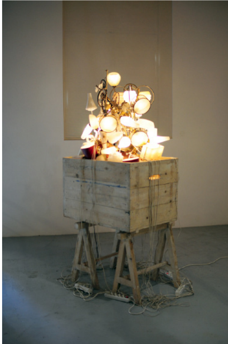
Pièce supplémentaire , 1998 Bois, luminaires, écran d'ordinateur 220 x 80 x 100 cm