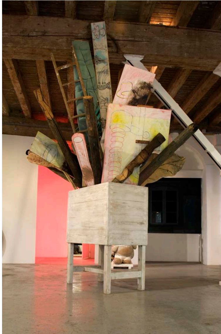
Pièce supplémentaire , 1998-2014 Matériaux divers Dimensions variables