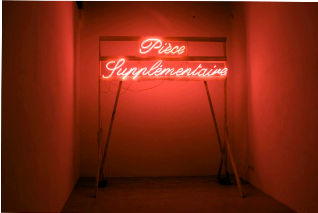
Pièce supplémentaire , 2010-2014 Bois, Néon 300 x 255 x 60 cm