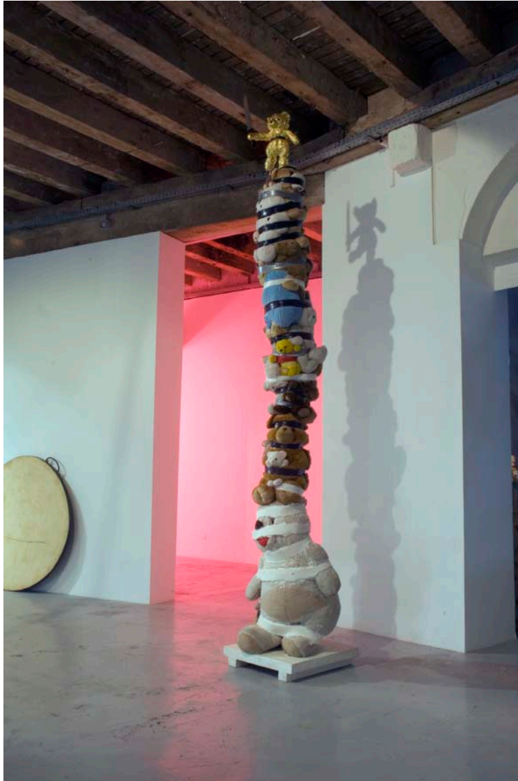
Pièce supplémentaire , 2009 Bois, plâtre, peluche 395 x 70 x 75 cm