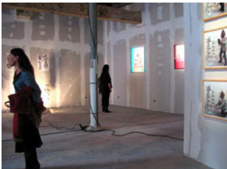
Vue de l'exposition de Dominique Angel, oct 2007