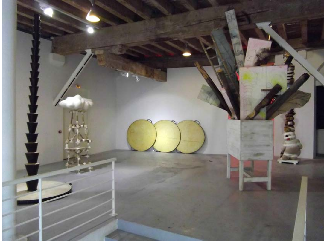
Vue partielle de l'exposition