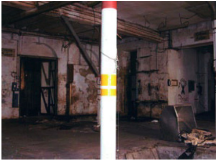
Local, juillet 2004