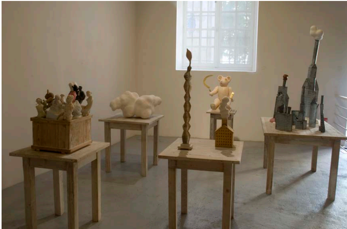
Pièce supplémentaire , 1998-2014 Matériaux divers Dimensions variables