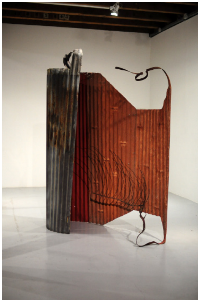
Sans titre , 1986 Tôle ondulée, pâte à papier, fer plat, fil de fer 290 x 260 x 100 cm