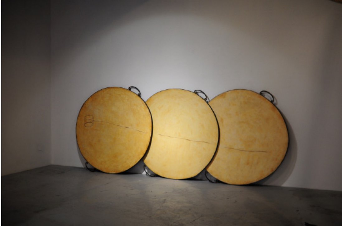
Pièce excentrique , 1991 Fer, plâtre, oxydation 150 x 350 x 50 cm