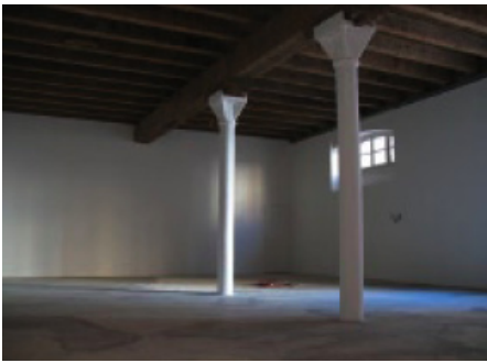
Local, avril 2009