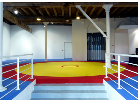
Vue de l'exposition Acta Est Fabula , fév 2011